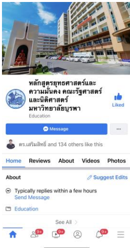
ภาพที่ 1 Facebook ของหลักสูตรยุทธศาสตร์และความมั่นคง

หลักสูตรได้ประชาสัมพันธ์หลักสูตรผ่านทางเว็บไซต์ของคณะรัฐศาสตร์และนิติศาสตร์ และ Facebook ของงานบัณฑิตศึกษาและหลักสูตรยุทธศาสตร์และความมั่นคง ตลอดจน Social Network ต่างๆ ทั้งของ ส่วนกลางคณะและของคณาจารย์ในหลักสูตร นอกจากนี้อาจารย์ประจำหลักสูตรทุกคนได้ประชาสัมพันธ์หลักสูตร ตัวตนเองในโอกาสต่างๆ ดังนั้น ผู้มีส่วนได้ส่วนเสีย สามารถเข้าถึงข้อมูลเกี่ยวกับหลักสูตรได้ตลอดเวลา