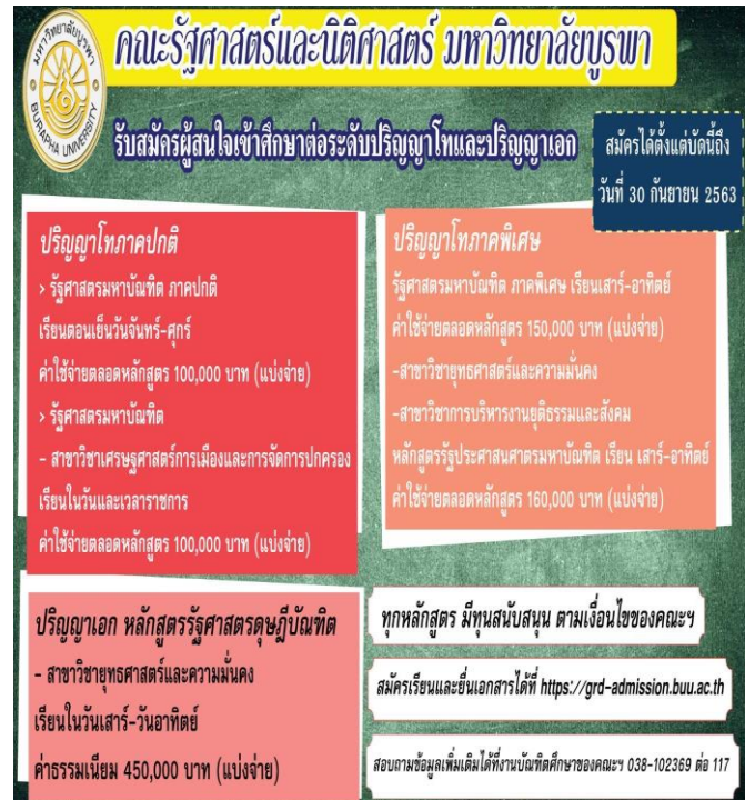
ภาพที่ 7 แผ่นพับ โปสเตอร์ ประชาสัมพันธ์หลักสูตร ที่เผยแพร่ในเว็บไซต์ Facebook Line